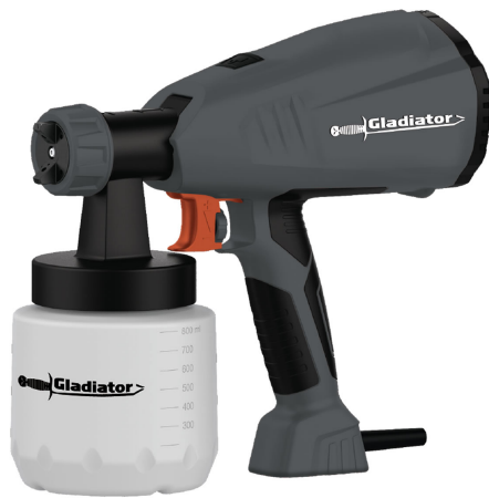
GLADIATOR EQUIPO DE PINTAR HV 6700 CÓDIGO: MI-GLA-049952